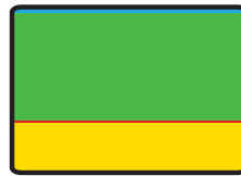
HARD BAK- EN BRAADVET