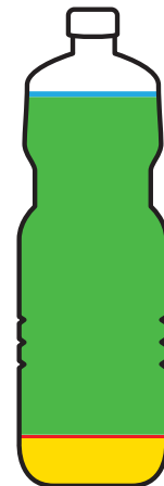
VLOEIBAAR BAK- EN BRAADVET