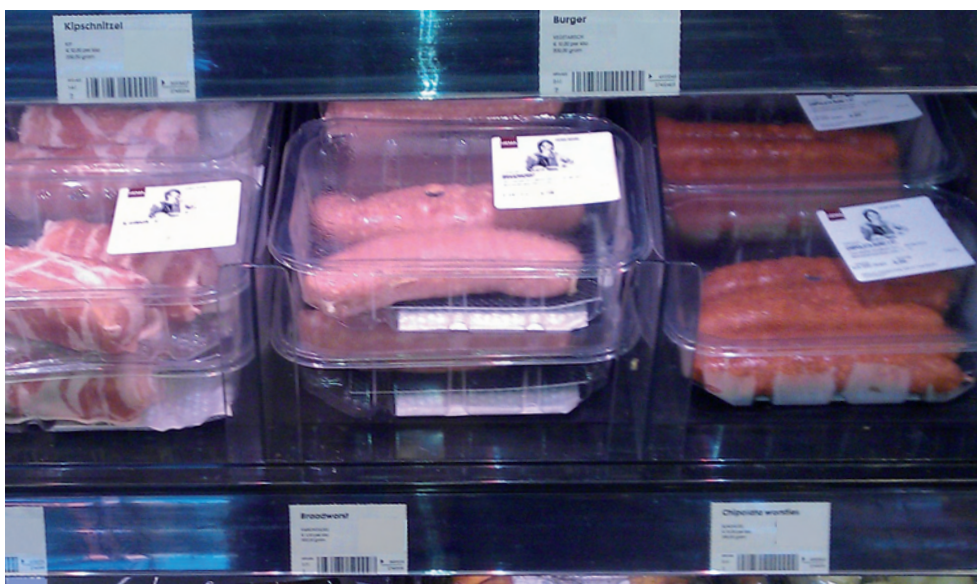
Voorals ouderen en 1-persoonshuishoudens vinden de verpakkingen (portiegrootte) in supermarkten te groot.

In het artikel De eierdoos van Columbus (VMT 7, 2012) hield het Voedingscentrum al een pleidooi voor een gouden standaard voor verpakkingen van 1,2, 3 of 6 porties. De conclusie was dat veel, of in elk geval een groot deel, van de verpakkingen niet zijn afgestemd op de dagelijkse behoefte per persoon en huidige grootte van huishoudens. Dat is ook terug te zien in dit onderzoek. Want hoewel een groot deel van de consumenten, vooral behorend tot de grotere huishoudens, tevreden is over de portiegrootte in de supermarkt, loopt